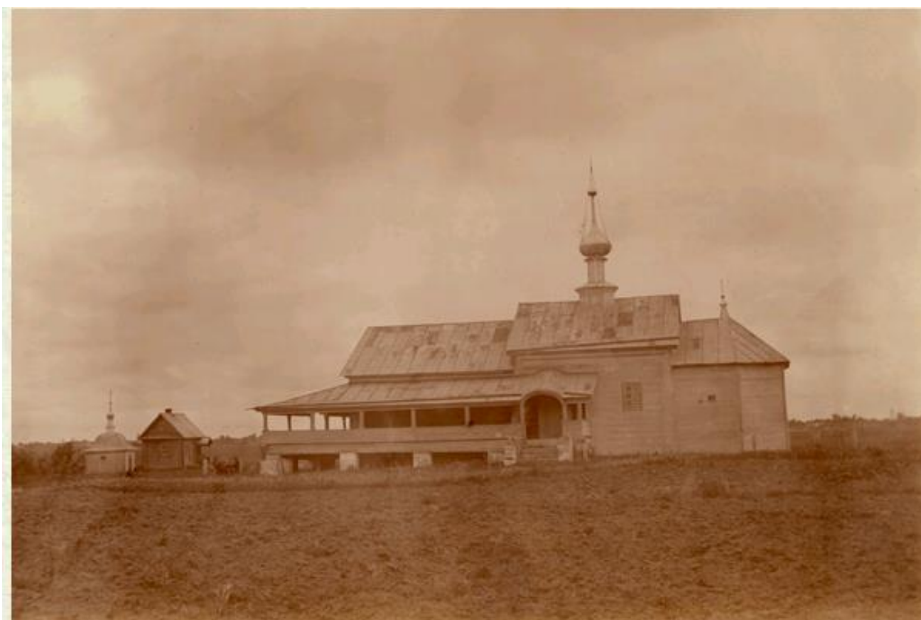
1900 г. Ильинский храм